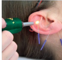
Einsatz über Akupunkturpunkte

In der Wundbehandlung hat sich der Laser durch seine Erfolge ein weiteres Einsatzgebiet geschaffen. Besonders „Problemwunden“, die schon längere Zeit bestehen, eignen sich für diese Therapie. Auch hartnäckige Ausschläge und Ekzeme können gut auf das Laserlicht reagieren. Gute Erfahrungen wurden auch bei Herpes simplex (Lippenbläschen) und Herpes zoster (Gürtelrose) gemacht.