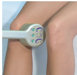
Laserbehandlung bei Kniegelenksentzündung